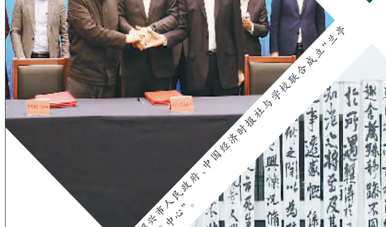
绍兴市人民政府、中国经济时报社与学校联合成立“兰亭国际研究中心”。