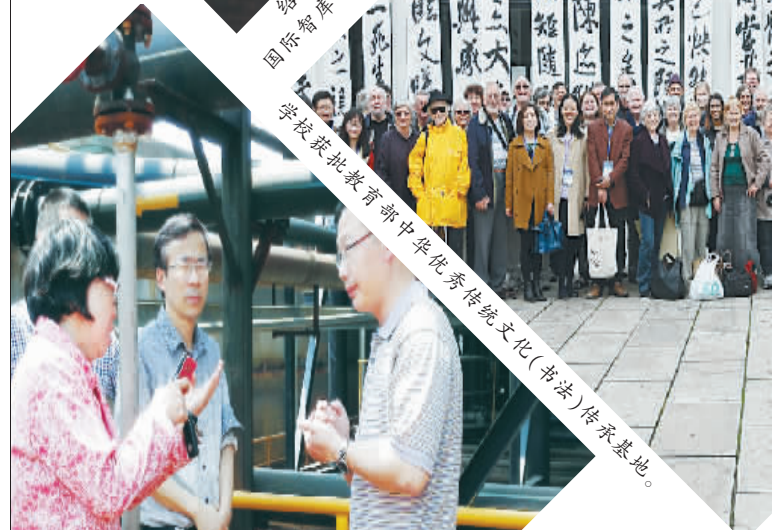
学校获批教育部中华优秀传统文化(书法)传承基地。