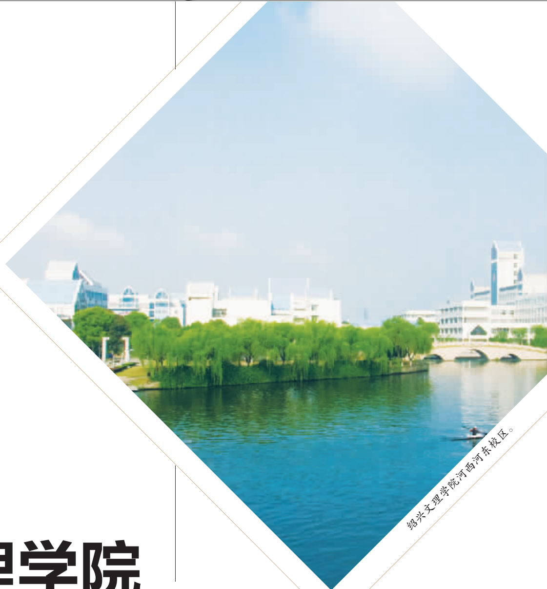
绍兴文理学院河西河东校区。