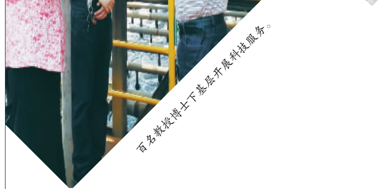
百名教授博士下基层开展科技服务。