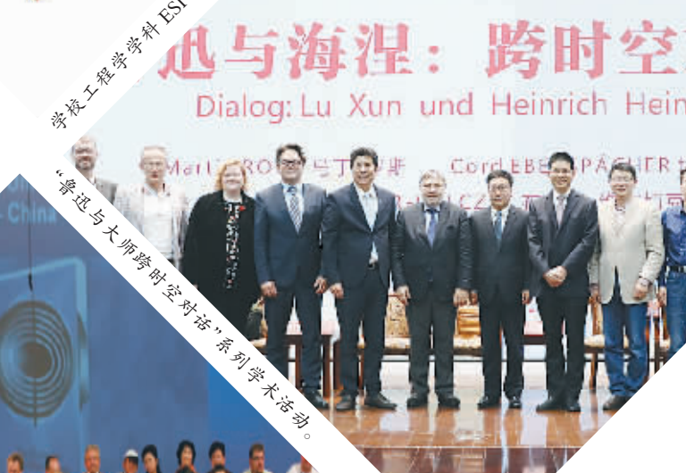
“鲁迅与大师跨时空对话”系列学术活动。