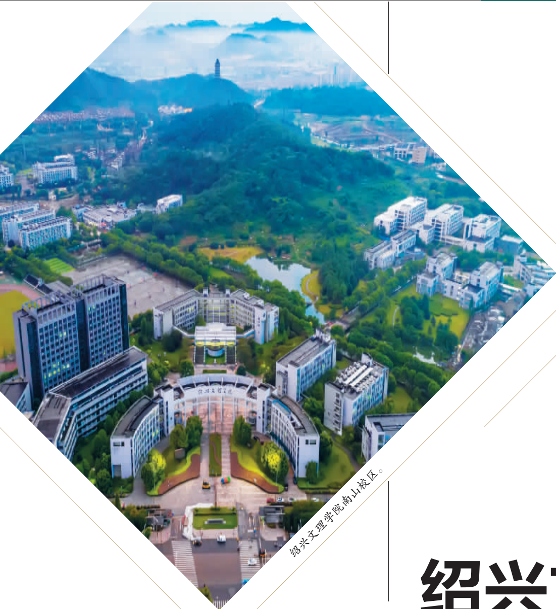
绍兴文理学院南山校区。