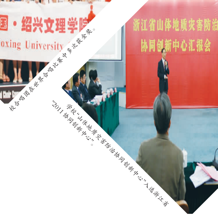
学校“山体地质灾害防治协同创新中心”入选浙江省。