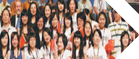
学校“山体地质灾害防治协同创新中心”入选浙江省。